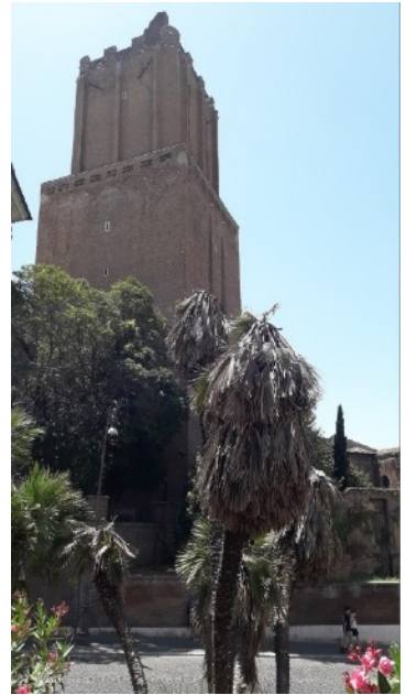
Palma nana morta a Via Magnanapoli