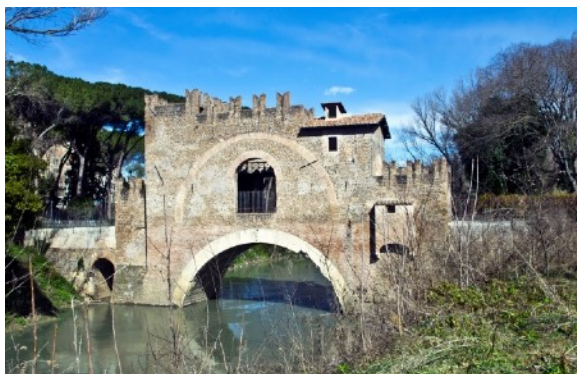
Ponte Nomentano sull'Aniene, le acque sono biologicamente morte

L'Aniene è un piccolo affluente, sembra poco importante, ma ha un bacino idrografico che da Roma al mare raccoglie più acque del Tevere in cui si riversa, è ancora pieno di biodiversità a monte di Tivoli ma come entra nel territorio metropolitano attraversando la città diventa biologicamente morto. Quando è in piena diventa una delle maggiori cause delle esondazioni e dell'inquinamento avvelenando le acque del Tevere fino al mare. La riserva naturale dell'Aniene è un parco regionale cittadino con importanti emergenze naturalistiche e storiche ma le acque del fiume sono inavvicinabili.